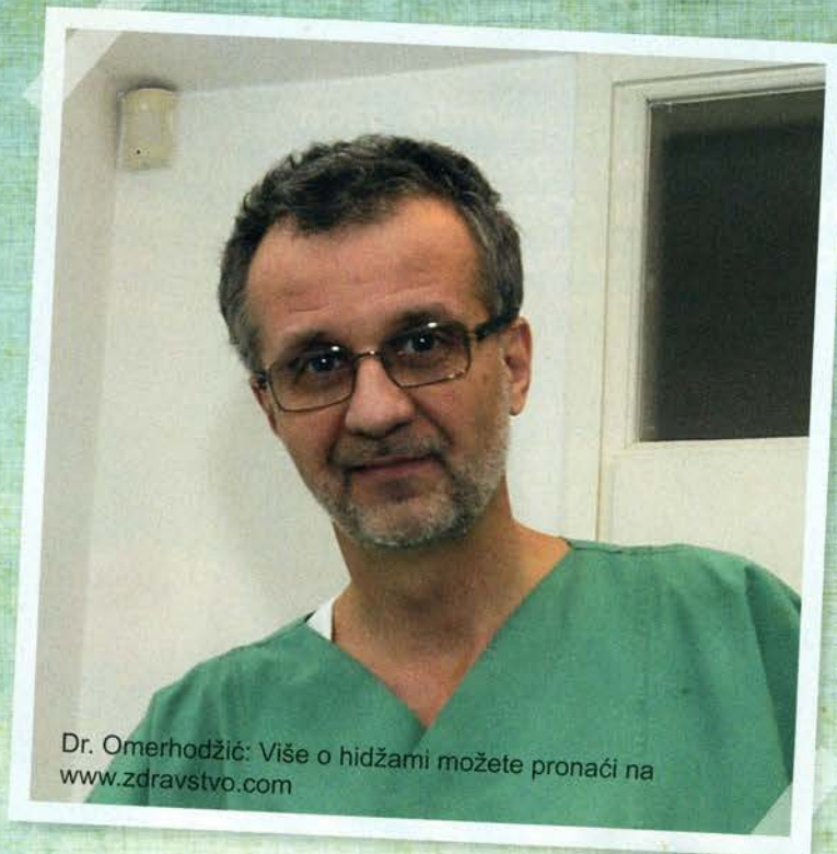
Dr. Omerhodžić: Više o hidžama možete pronaći na www.zdravstvo.com

PIŠE: ELVEDINA DŽAKMIĆ